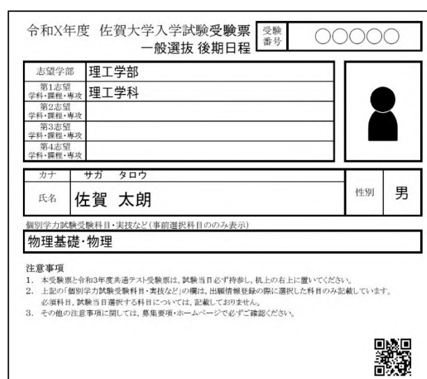
図1. QRコードを埋め込んだ受験票イメージ

佐賀大学では、試験当日の手続きにも電子情報を活用できる仕組みを検討し、受験票にQRコードを埋め込んで印刷できるように改修した(図1)。