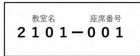
図3. 座席番号票のイメージ（紙で作成）

以上のように、「受付順配席方式」を実現するために、試験当日に設けた受付で受験票のQRコードを読み込み、試験室と受験座席を配置する方法について、本稿では「新方式」と呼ぶことにする。